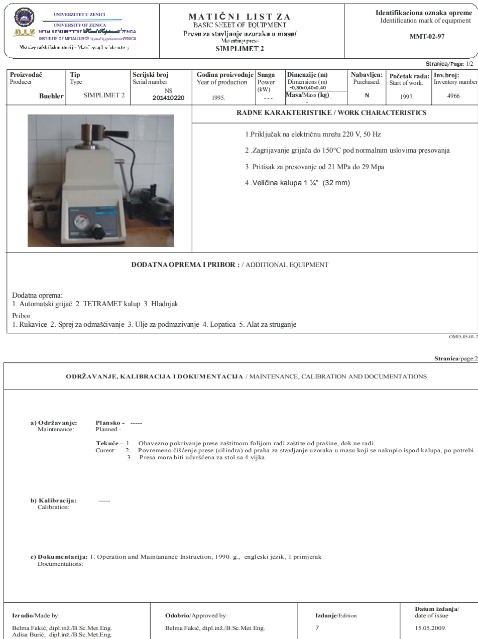
Slika 1. Matični list za hidrauličnu presu za upresavanje metalografskih uzoraka SIMPLIMET 2

Primjer matičnog lista za hidrauličnu presu za upresavanje metalografskih uzoraka SIMPLIMET 2 dat je na slici 1.